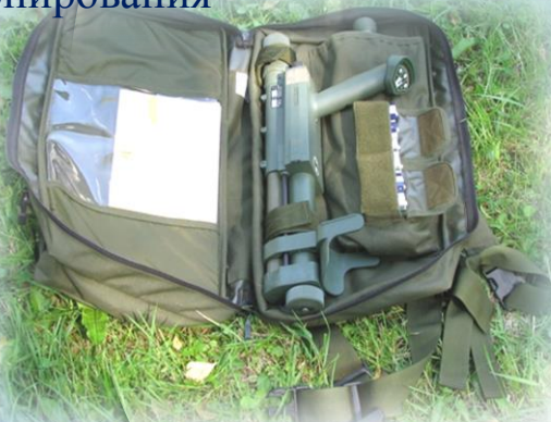
Металлодетектор Vallon VMH-3CS