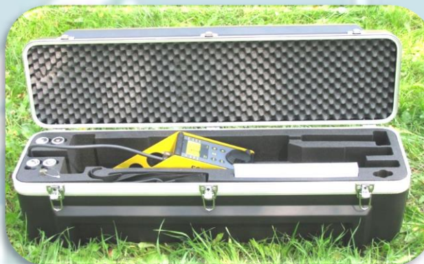
Магнитометр Ferex 4.032