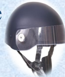
Шлем с визором