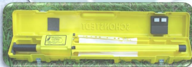
Магнитометр Shonstedt GA-72Cd